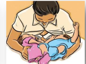
Posisi untuk bayi kembar